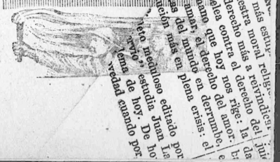
Una liberación para un hombre que se rinde a la fuerza...