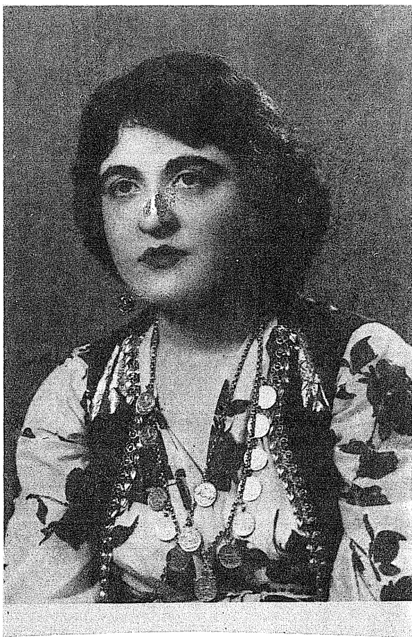
من منالہ کہم کہ تو بیان کو شتم ٹازاری سہختو سو سیان پی چہ شتم